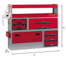
5006 C2 - Assortment for left side